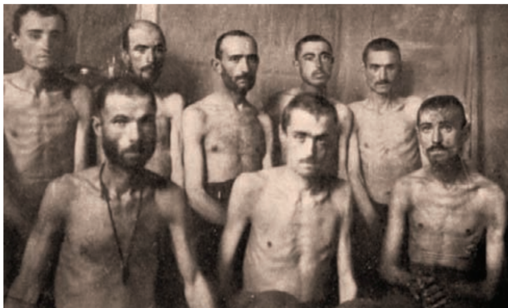
Izgladnjeli gorštaci prije kupanja u logorskom kupatilu

U logoru Nađmeđer bio je i jedan guslar iz Crne Gore. Dugim i strpljivim radom od limene porcije napravio je gusle. U logoru je jednog dana odjeknuo glas gusala i zvonki glas Crnogorca. Prkosno je zapjevao o Baju Pivljanu. Stražar je oslušnuo pjesmu guslara, a zatim bez ičijeg naređenja otvorio vatru na njega. Zvuci gusala su prekinuti. Guslar je pao mrtav, nekoliko logoraša je ranjeno