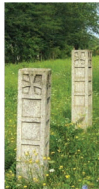
Groblje u Nađmeđeru

U knjizi „Nađmeđerska dolina smrti“ crnogorski logoraš Risto Kovijanić opisao je svoje utiske nakon posete logorskom groblju u Nađmeđeru 1936. godine. On je iste godine