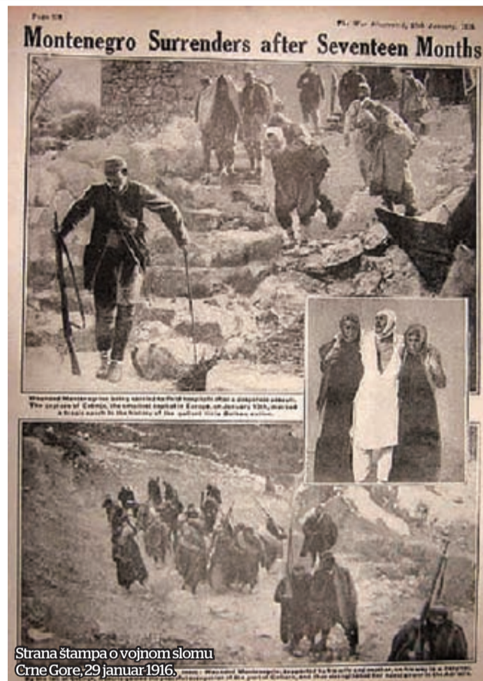
Strana štampa o vojnom slomu Crne Gore, 29 januar 1916.