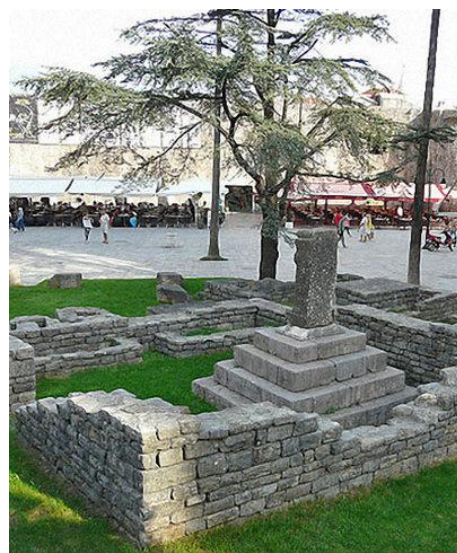
Antička nekropola u Budvi