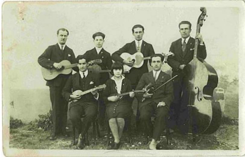
Orkestar društva iz Petrovca - tridesete

Svakako u kontekstu kulturnog stvaralaštva nezaobilazan je Paštrovski almanah I i II (2015-2016) čiji je treći broj u pripremi. Ova publikacija koju uređuje dr Miroslav Luketić, predstavlja zbirku tekstova domaćih i inostranih autora na različite teme iz oblasti umjetnosti, kulture, društveno-ekonomskih pitanja Paštovića.