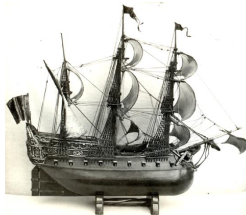
Nava- Pomorski muzej Kotor