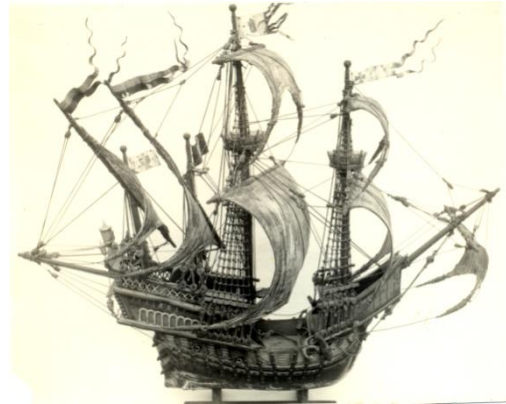
„Karaka“, Pomorski muzej Kotor

46 - JEDRENJACI ... u periodu 1326-37 pominje se samo 7 jedrenjaka. Najveći je nava „ Sv.Marko “ Trifuna Buće...U kratkom periodu 1395-1400, pominje se 17 domaćih jedrenjaka: 11 barkozija, 2 marselijane, 1 nava, grip, diskrerija i skaba.... od 1419-21, pominju se 4 barka, 1 karaka, 1 koka. U periodu 1430-1450 pominje se 100 domaćih jedrenjaka – 60 barkozija, među kojima nekolike karake i koke, 23 barka, 3 nave, 3 križnika, 1 marselijana, 1 grip, 3 skabe i 3 copola.... pominju se 20 brodograditelja, i veliki broj pomoraca; ima oko 40 kapetana-suvlasnika. Samo u dvije godine, 1446. i 1450. pominje se 90 pomoraca, od kojih 30 kapetana. Svi imaju klasična slovenska imena.