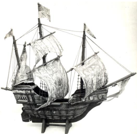
Karavela – Pomorski muzej Kotor

46 - JEDRENJACI ... u periodu 1326-37 pominje se samo 7 jedrenjaka. Najveći je nava „ Sv.Marko “ Trifuna Buće...U kratkom periodu 1395-1400, pominje se 17 domaćih jedrenjaka: 11 barkozija, 2 marselijane, 1 nava, grip, diskrerija i skaba.... od 1419-21, pominju se 4 barka, 1 karaka, 1 koka. U periodu 1430-1450 pominje se 100 domaćih jedrenjaka – 60 barkozija, među kojima nekolike karake i koke, 23 barka, 3 nave, 3 križnika, 1 marselijana, 1 grip, 3 skabe i 3 copola.... pominju se 20 brodograditelja, i veliki broj pomoraca; ima oko 40 kapetana-suvlasnika. Samo u dvije godine, 1446. i 1450. pominje se 90 pomoraca, od kojih 30 kapetana. Svi imaju klasična slovenska imena.