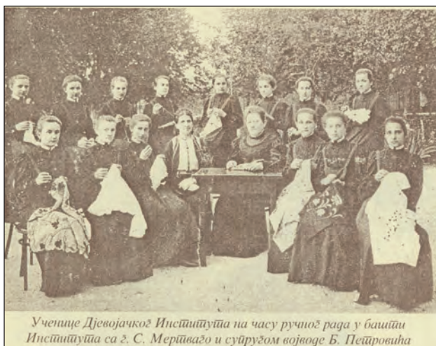
Slika 5: Učenicе Djevojačkog instituta (Rovinski, 2000, 226)