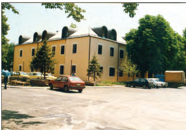
Slika 2: Djevojački institut danas ((Izvor: http://www.studentskidomct.me )