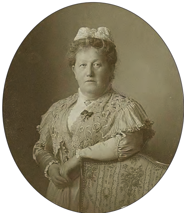
Slika 4: Sofija Petrovna Mertvago (1851–1921), upraviteljica Djevojačkog Instituta na Cetinju

bila stjecište literarnih besjeda i intelektualnih diskursa, završila je prije vremena Institut, dobivši specijalnu nagradu i priznanje za postignute rezultate. Još u svom obiteljskom domu, svladala je besprijekorno francuski, njemački i engleski jezik, a pogodujuće obiteljske prilike omogućile su joj obilazak različitih kulturnih areala i proširivanje znanja o specifičnostima europskih različitih etniciteta, umjetničkih znamenitosti i folklorističkih osobitosti drugih sredina, pa će joj ta iskustva biti od značaja pri kreiranju programa i ukupnog etosa Djevojačkog Instituta na Cetinju (Martinović, 1995, 60). Mertvagova, izuzetna prosvjetiteljka, koja je pored veoma solidnog obrazovanja, stečenog na Smoljnom institutu, dragocjeno iskustvo razvijala i gradila kao upravnica Marijinske ženske gimnazije u Rjazanu, energično je prišla radikalnom preuređivanju cetinjske djevojačke škole, obezbijedivši, za početak, novčanu podršku od ruske carice-pokroviteljke, u iznosu od 10.000 guldena (Martinović, 2000, 63). Narednih godina povećane su godišnje subvencije za Institut na 10.000 austrijskih fiorina, a Carica M. Fjodorovna je tražila i dodatnu pomoć od ministra finansija (DMC–AO, 1900, XLVIII), te je škola postepeno transformirana u uređenu, po ondašnjim europskim standardima organiziranu, na ovim prostorima jedinstvenu multikulturalno koncipiranu instituciju, a pohađale su je u sve većem broju učenice i iz drugih južnoslavenskih sredina (Rovinski, 2000).