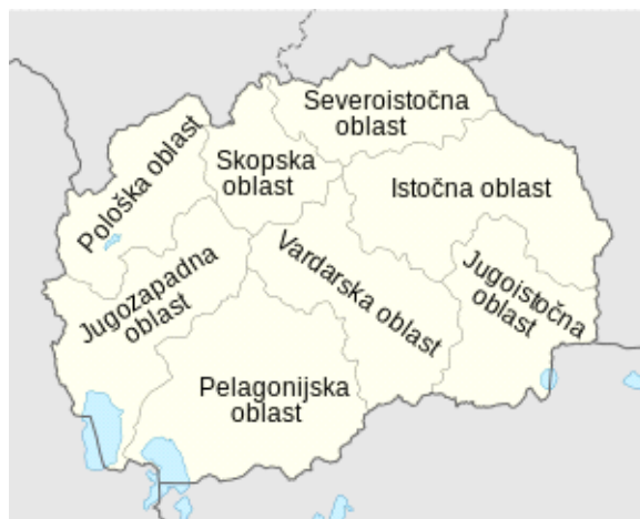
Sl.5. Karta statističkih oblasti Sjeverne Makedonije